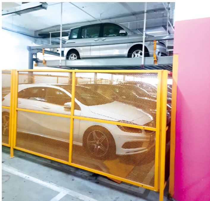
安裝拼合式系統後，柱後空間亦可用作泊車