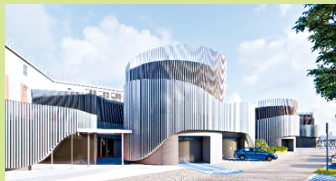
深水埗欽州街的「圓筒型系統」 (現於設計階段)