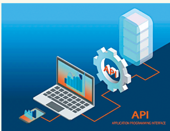
以API建立資訊互通的橋樑

不少物業管理公司和承辦商均設有電腦系統，以儲存及分析升降機/自動梯的資料。數碼工作日誌的網上平台新增了「應用程式介面」(API)功能，讓用家在自家電腦系統和數碼工作日誌之間建立資訊互通的橋樑，自動把數碼工作日誌上的工程資料傳輸到用家的電腦系統，作進一步分析。