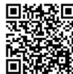
《設置機械化泊車系統的指引》

擬引入到香港的泊車系統須符合歐盟標準EN14010—機械安全—動力驅動的汽車停泊設備：設計、製造、安裝和試運行階段的安全和電磁兼容性要求。除了機械安全，項目倡議者亦須注意噪音、消防和建築物安全要求、運作及對相鄰道路交通的影響，以及是否與周圍土地用途相容。泊車系統的設計亦應包含後備電源之類的應急設施，容許系統在停電或設備故障的情況下，以手動模式把車輛放回到地面。詳情請參閱機電工程署（機電署）發出的《 設置機械化泊車系統的指引 》。