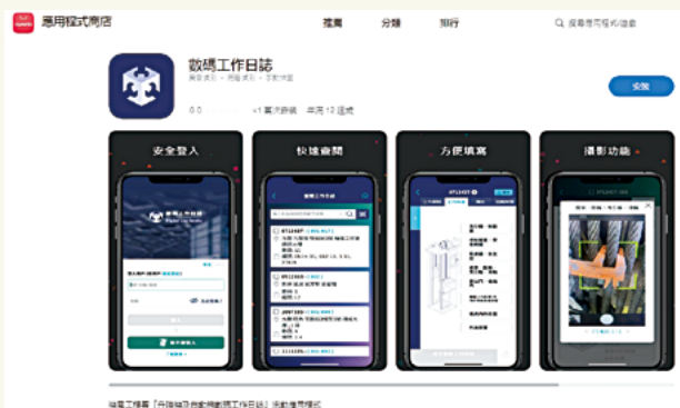
圖2-在華為應用程式市場下載數碼工作日誌流動應用程式