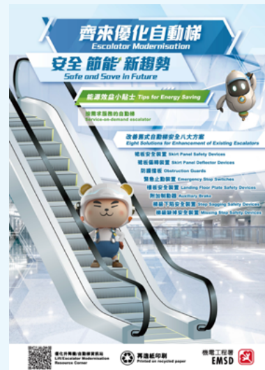
優化自動梯宣傳海報