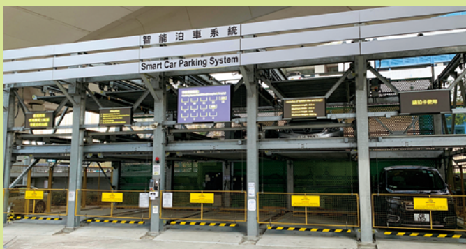
機電工程署總部的「拼合式系統」