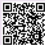
預防工作時 中暑指引