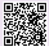
預防工作時 中暑的風險評估