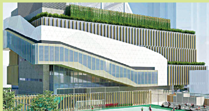
新蒲崗四美街的「垂直升降及橫向滑動系統」 (現於施工階段)