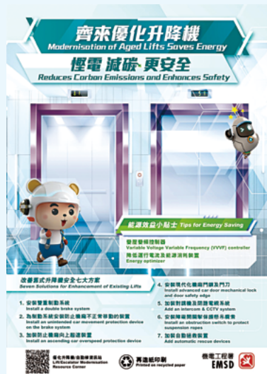
優化升降機宣傳海報

另外，為進一步推廣優化舊式升降機，機電署在2024年2月於72個郵箱上張貼優化升降機的宣傳海報，並重點於較多舊式升降機的地區，包括深水埗、土瓜灣、筲箕灣、西營盤等進行推廣，藉此提醒負責人為舊式升降機進行優化。