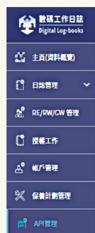
數碼工作日誌的API功能