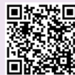
工作暑熱警告 簡介