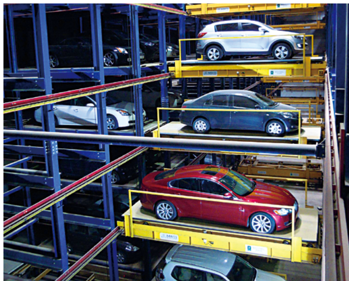
垂直升降及橫向滑動系統

垂直升降及橫向滑動系統一般裝設在約3至10層高，車位數量眾多的大型停車場內。車輛會先由升降平台運送到目標樓層，再由橫向滑動的搬運車運到指定車位，最後由搬運器把車輛放到指定車位上。